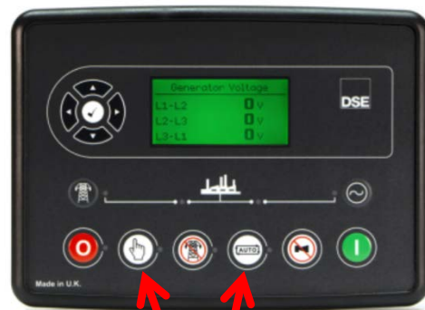
運転モードの切替